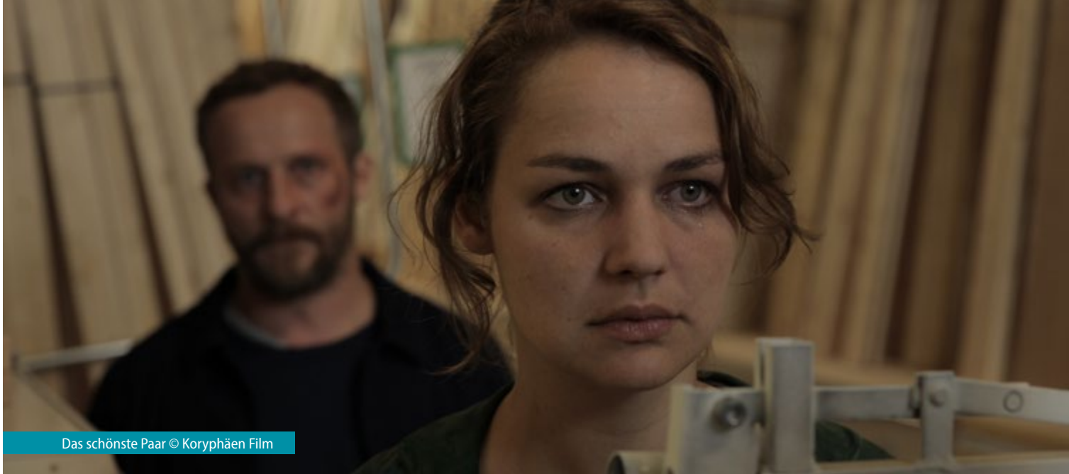
Das schönste Paar