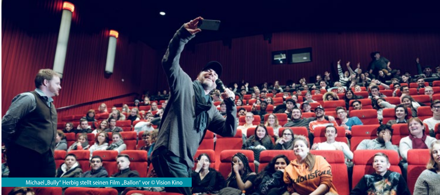
Michael „Bully“ Herbig stellt seinen Film „Ballon“ vor