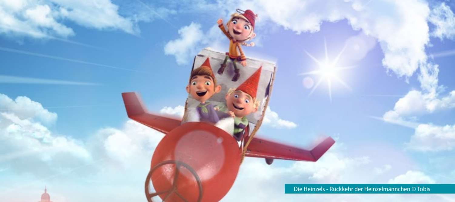
Die Heinzels - Rückkehr der Heinzelmännchen