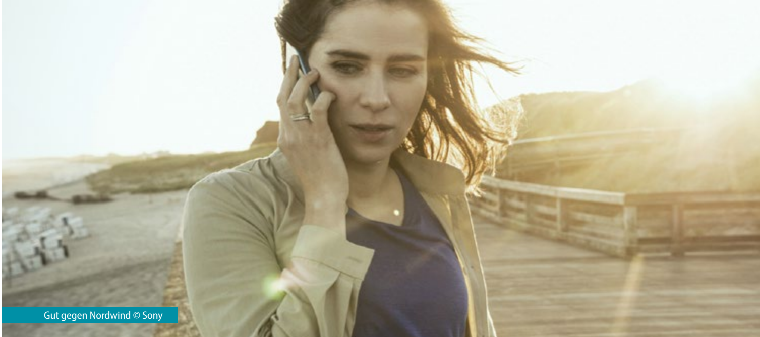
Gut gegen Nordwind