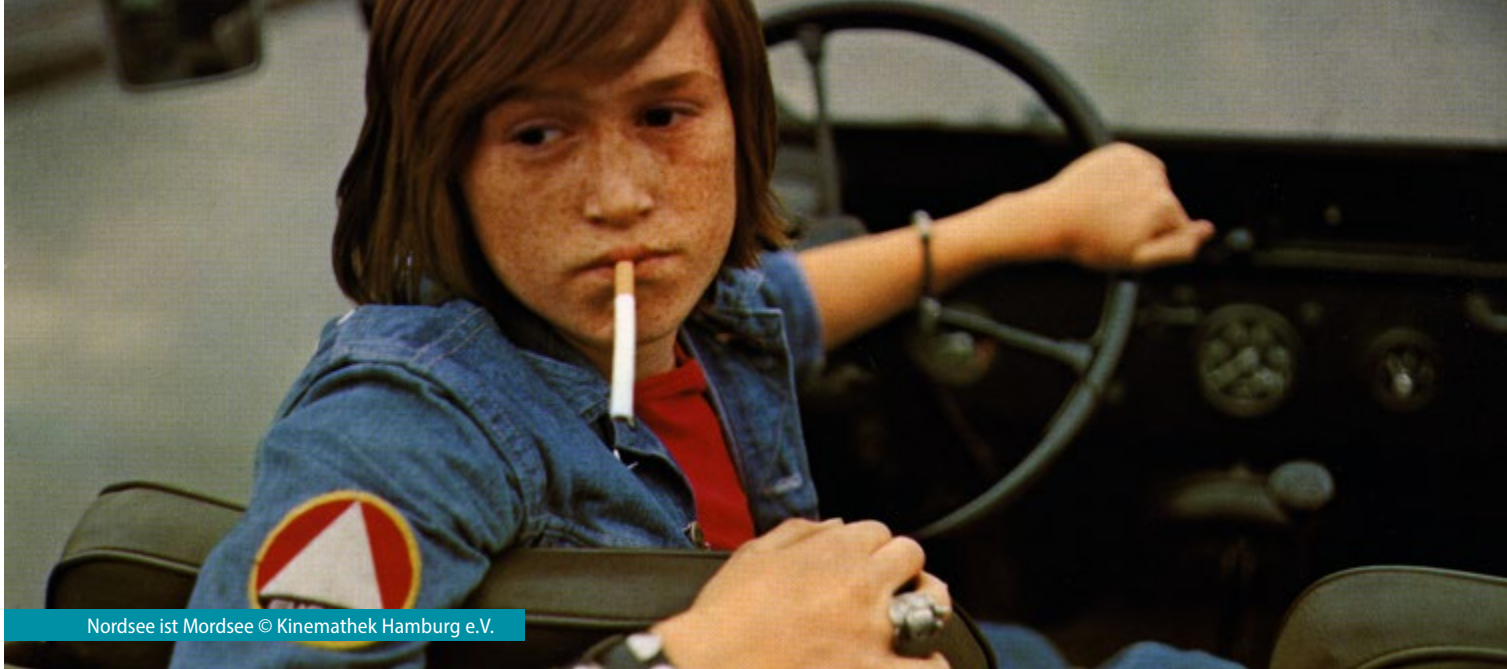
Nordsee ist Mordsee