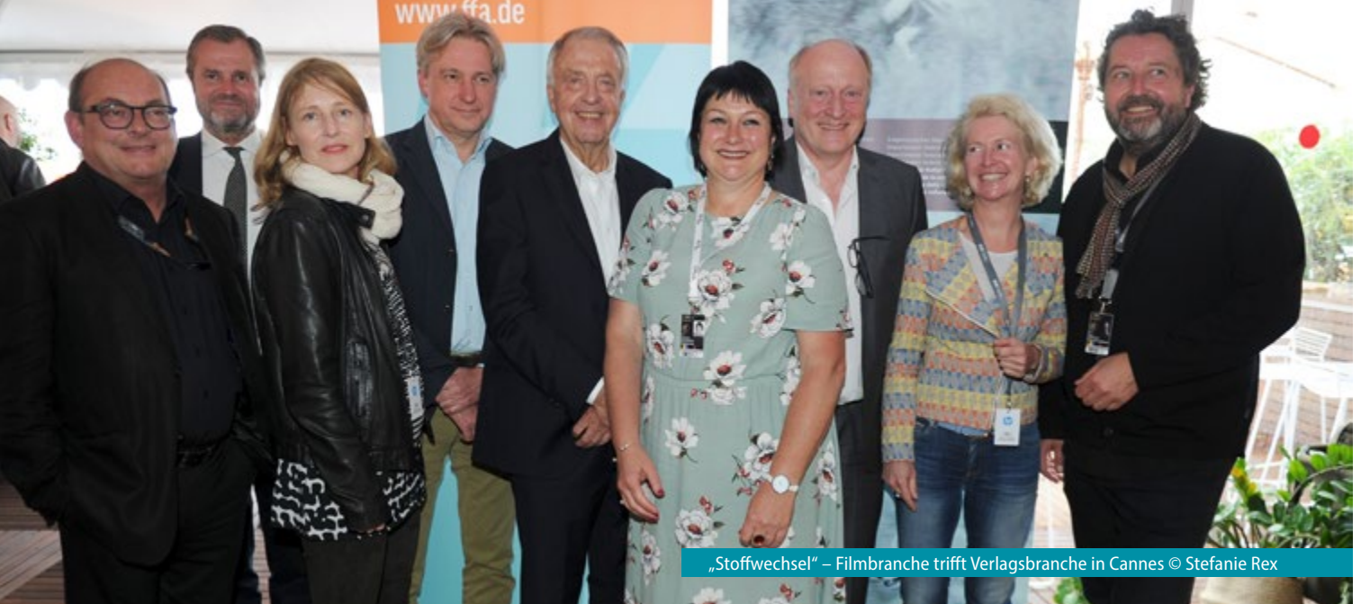
„Stoffwechsel“ – Filmbranche trifft Verlagsbranche in Cannes