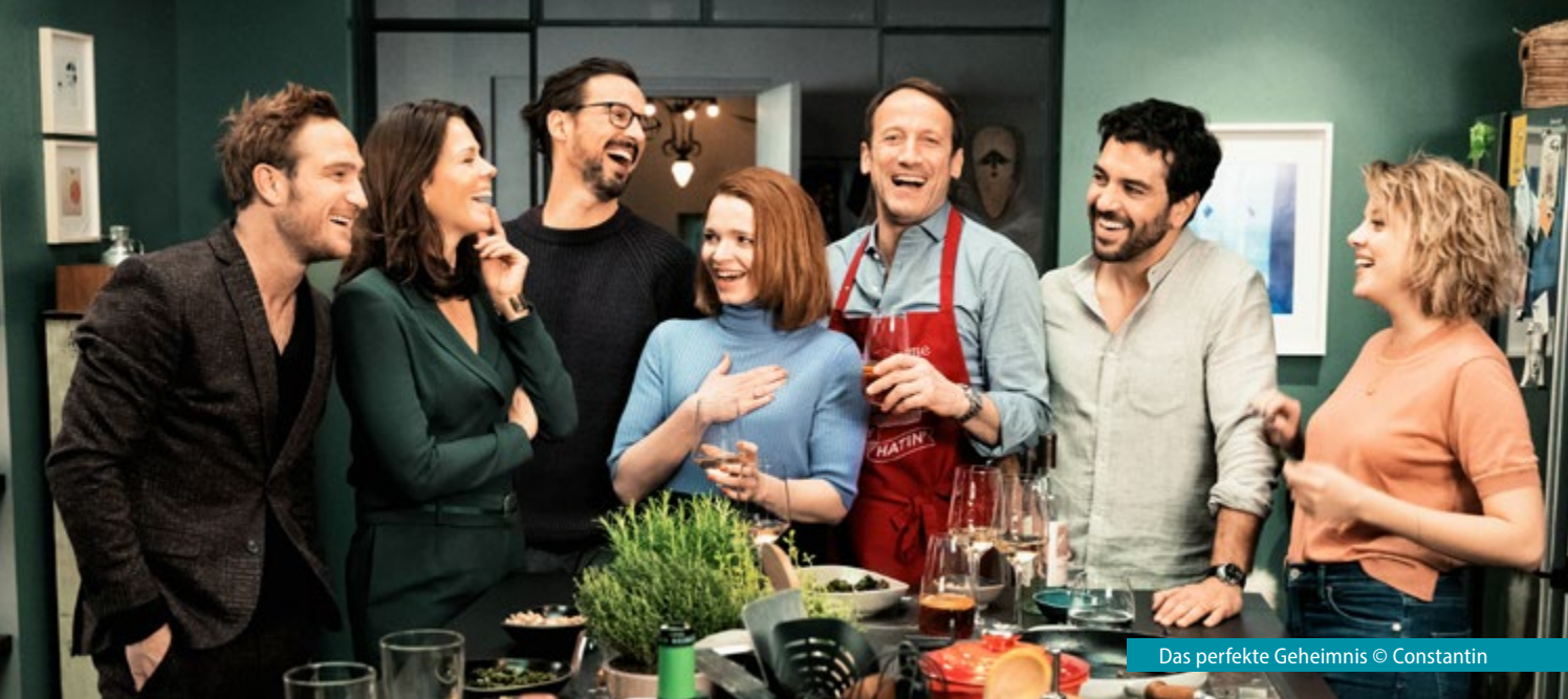
Das perfekte Geheimnis

Elementare Aufgabe der FFA ist die Förderung des deutschen Films. Dies kann auf die unterschiedlichste Weise geschehen. In diesem Bericht spiegeln wir ein Gesamtbild der Förderaktivitäten der FFA wider. Es werden die einzelnen Förderbereiche dargestellt, und es wird dargelegt, welche Mittel in den einzelnen Bereichen eingesetzt wurden. An dieser Stelle kann nur ein grundsätzlicher Überblick gegeben werden, detaillierte Angaben zu den einzelnen Förderbereichen stehen in den Anlagen ab Seite 50 .