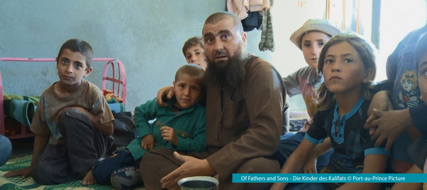
Of Fathers and Sons - Die Kinder des Kalifats