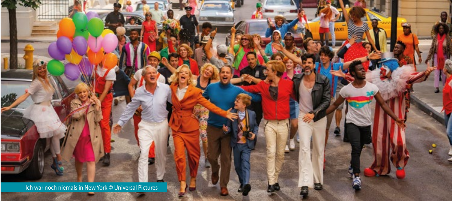
Ich war noch niemals in New York