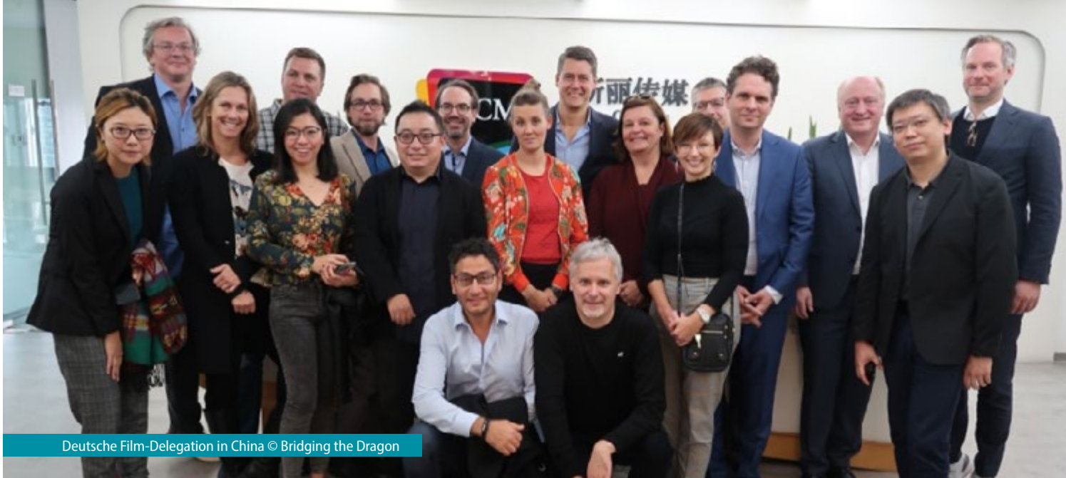
Deutsche Film-Delegation in China

mit Produzent*innen und der Verlagsbranche ein. Die Initiative bot rund vierzig Teilnehmer*innen am Rande des Festivals die Gelegenheit, Kontakte und Geschäftsbeziehungen mit dem Team der Frankfurter Buchmesse, zahlreichen Vertreter*innen von Verlagen und Autor*innen zu vertiefen.